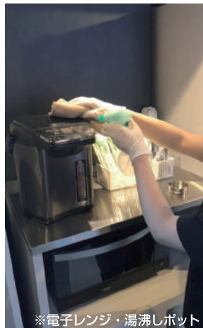
※電子レンジ・湯沸しポット